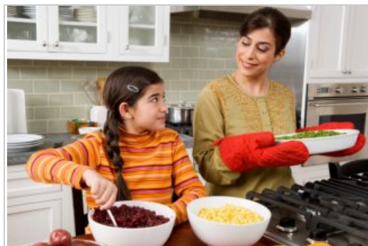
Participando del Día de Acción de Gracias

inolvidable junto a nuestros niños, que también necesitan esta fecha para ir construyendo sus recuerdos. Para ello, es fundamental que estén entretenidos y puedan acoplarse junto a nosotros en el festejo que hemos preparado.